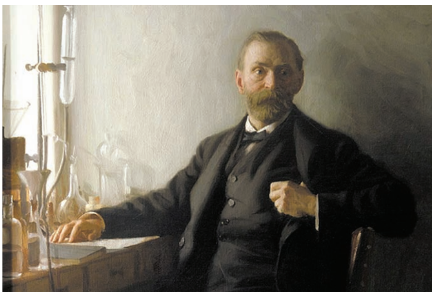
Альфред Нобель в останні роки життя

• Увійти в історію завжди було мрією всіх Нобелів чоловічої статі, починаючи з ХУІІ століття. Але й острах бути похованим заживо також передавався від Нобеля до Нобеля так само, як і бажання стати безсмертним у віках. І найбільше цим страхом був охоплений Альфред. Принаймні тільки йому спало на думку внести у заповіт спеціальний пункт: