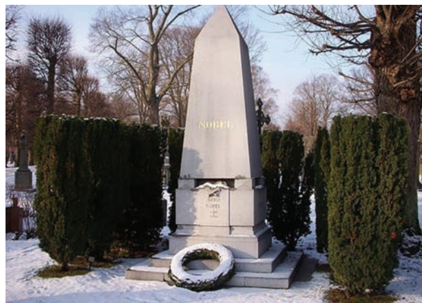
Могила Альфреда Нобеля

Подібну стислу інформацію про життя і діяльність Альфреда Нобеля можна знайти майже в кожній із вікіпедій, енциклопедій, у біографічних довідниках на багатьох мовах світу [3–6]. Але чи достатньо цієї інформації, аби скласти уяву про А. Нобеля як людину? Певно, що ні. Тому ми спробували віднайти й такі факти з його життя, які різнобічно характеризують цю непересічну особистість.