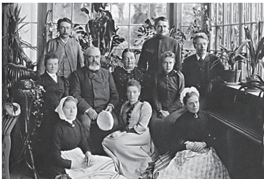
Сім'я Еммануеля Нобеля

У Росії Альфред і його брати навчалися у приватних репетиторів, а в 1850 р. батько відправив Альфреда на три роки подорожувати до Європи і США. У столиці Франції Альфред вивчав хімію в лабораторії Теофіла Пелуза, який