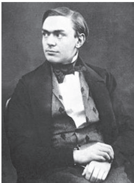
Альфред Нобель у молодому віці

у 1836 р. визначив склад гліцерину і разом з Асканіо Соберо у 1840–1843 рр. працював над створенням нітрогліцерину .